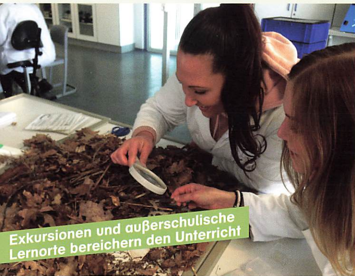
Exkursionen und außerschulische Lernorte bereichern den Unterricht